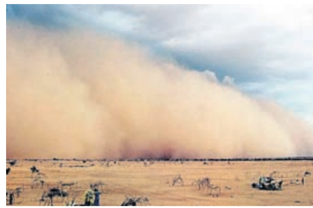
Clyde Harms: Ghibli di Libia a alcanza mi na Aruba